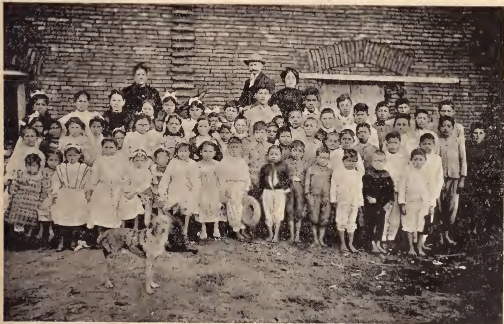
Escuela Forneron, en Misiones (Paraguay)

Durante el curso del año 1909, recibíamos la primera noticia de aquel emprendedor valdense, que deseaba dotar la colonia que en su propio terreno fundara años antes, con una escuela; los planos del edificio, si bien demostraban que era un proyecto sencillo, no obstante revelaban una mira preciosa. La casa-escuela, que tuvimos el placer de visitar en nombre del Consejo Nacional, es mucho mejor que las que usamos para idéntico